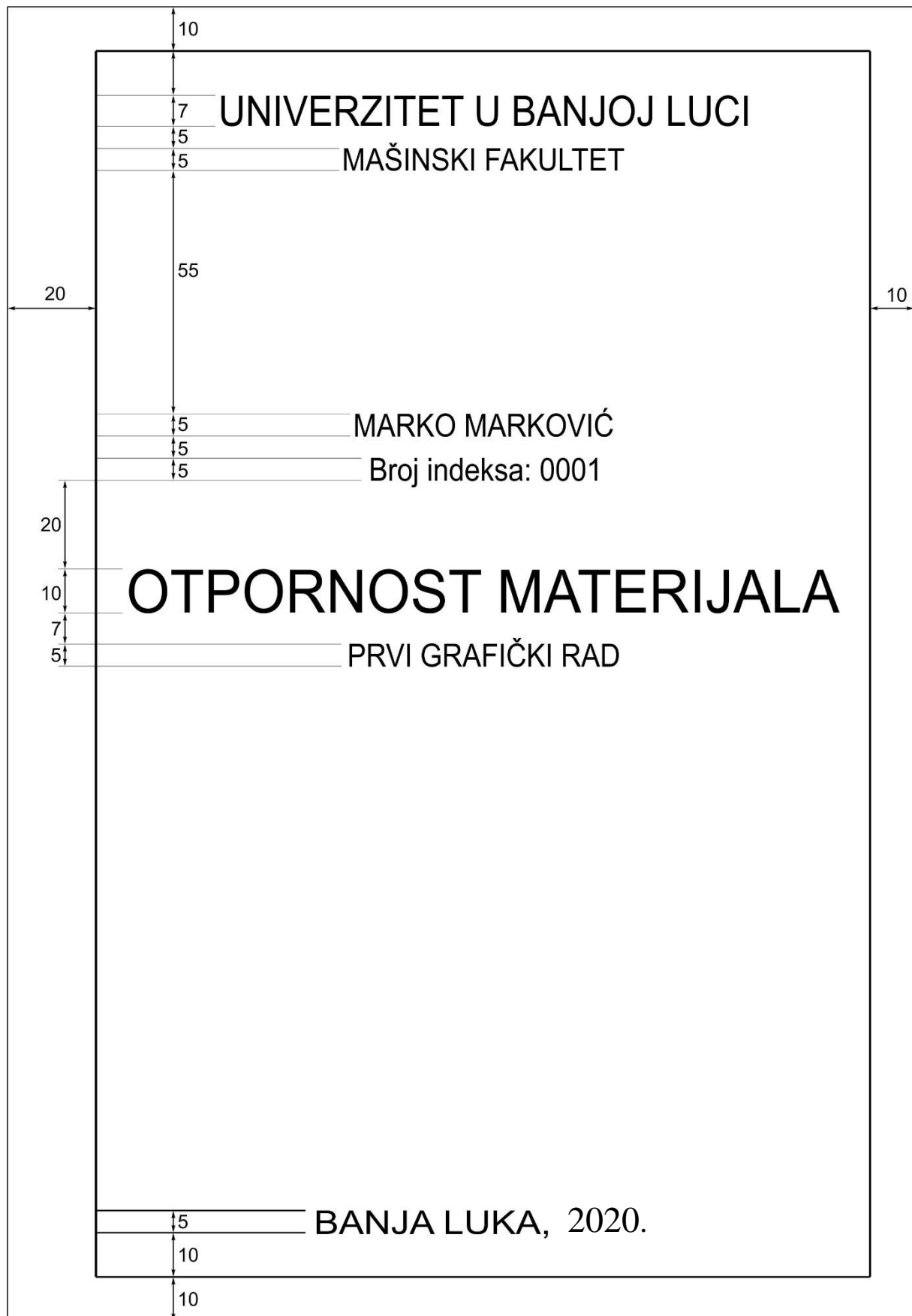
Sl. 2 Izgled naslovne strane grafičkog rada